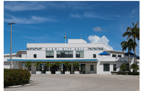
Fotografía Zona de Coconut Grove 2021