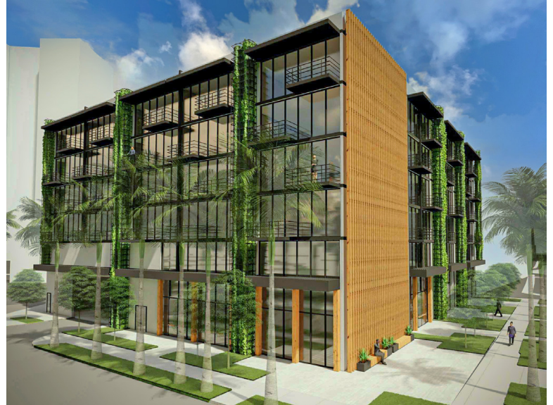
Rendering conceptual del artista.

Coconut Grove combina varios de los elementos más atractivos de la ciudad de Miami. El estar ubicado frente al mar, con muchos parques, zonas verdes, palmeras, árboles frondosos; mientras que al mismo tiempo cuenta con una gran variedad de restaurantes, sitios de entretenimiento y tiendas con mucha personalidad y estilo, hacen de Coconut Grove un remanso de tranquilidad dentro de la bulliciosa Miami. Un destino preferido por locales y visitantes que hoy respira aires de renovación. Sin embargo, Coconut Grove nunca ha perdido su delicioso ambiente, fresco y sofisticado, el cual hoy se enriquece con la presencia de magníficos proyectos residenciales.