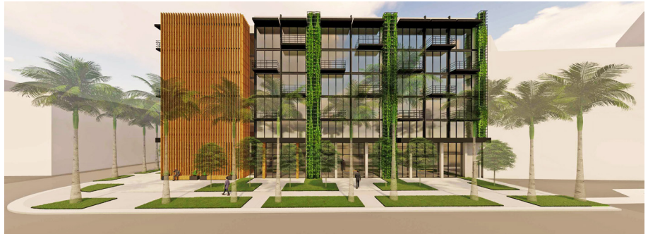
Rendering conceptual del artista.